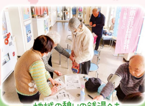
地域の憩いの銭湯へも