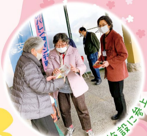
日帰り入浴施設に参上