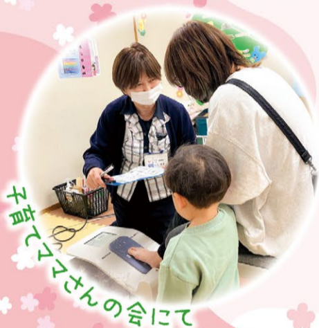
子育てママさんの会にて

地域の組合員さんによる活動を通して人と人との交流が進み、地域社会が連帯感を取り戻しています。多くの人々が楽しく参加できる医療生協の健康づくり活動を通じて、新しいつながりが地域のネットワークとなり、互いに助けあい支えあう「誰もが健康で、居心地よく暮らせる」まちづくりを実現しましょう。