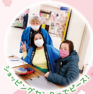
ショッピングセンターでピース!