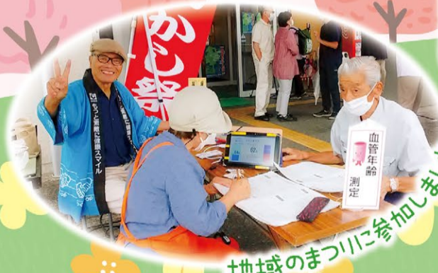
地域のまつりに参加しました