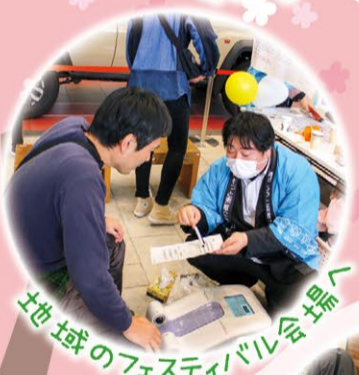
地域のフェスティバル会場へ