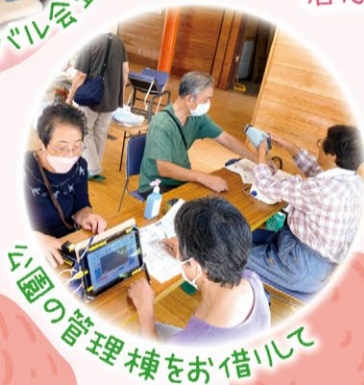
公園の管理棟をお借りして