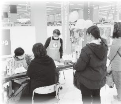
2月22日 山室支部 グリーンモール山室にて 健康チェック