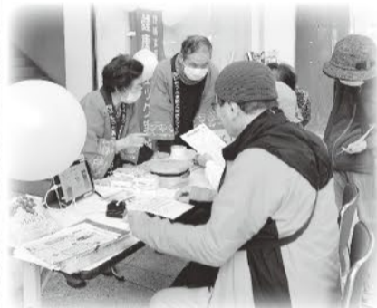
2月14日 中央西支部 CiCエントランスホールにて 健康チェック

居心地よくらせるまちづくりへの挑戦…「ここに医療生協があってよかった!」そんな声が聞こえてくるような活動をあちらこちらでこれからも!