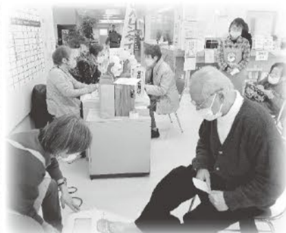
2月14日 北ブロック支部合同 富山協立病院外来にて 健康チェック