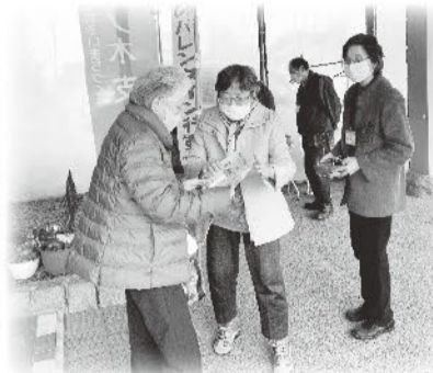
2月14日 藤ノ木支部 ファミリー温泉ひらきの湯にて 宣伝行動

毎年2月、バレンタインデーの時期に合わせて、全国一斉に医療福祉生協活動をお知らせする「虹のバレンタイン行動」が取り組まれています。