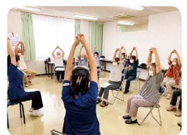
9月15日 南部支部 健康ひろば 11名参加