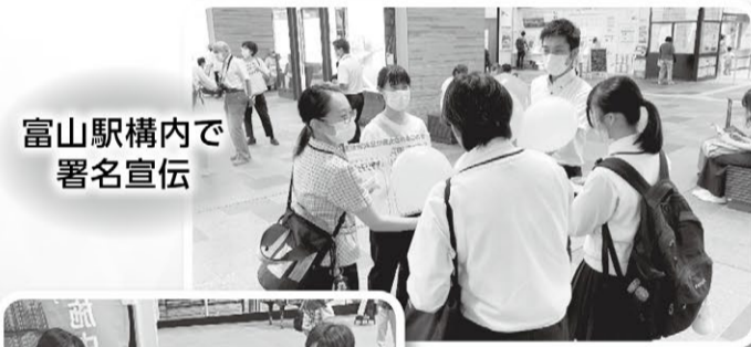
富山駅構内で署名宣伝