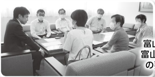
富山県議会、富山市議会への要請行動

9月7日に、富山医療生協を含む10団体で富山県議会へ健康保険証存続を求める請願書を提出しました。自民党をはじめとする各会派を訪問し、私たちの声を届けました。また、9月22日には、多くの組合員も参加し、富山駅構内で署名宣伝行動も行いました。引き続き健康保険証存続を訴えていきます。