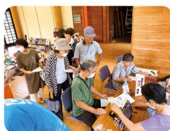
9月20日 呉羽支部 健康チェックひろば 24名参加