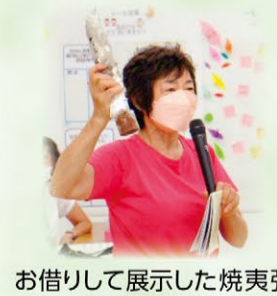
お借りして展示した焼夷弾

戦争は何も得る物はありません。失うばかりです。核兵器!!言語道断!! 子や孫・未来の子ども達には平和な世の中をのこさなければ! 人間は話せば分かる! 平和外交を求めます! 一言メッセージより