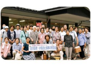
7月29日 荻浦支部 支部レク 庄川温泉 30名参加