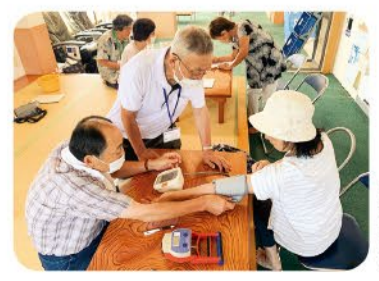
7月26日 藤ノ木支部 ひらきの湯健康チェック 12名参加