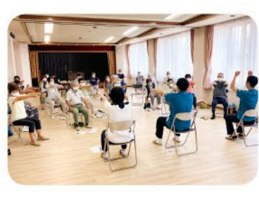
7月26日 やくし支部 体操交流会 26名参加