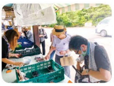
8月24日 広田支部 ぶどう買い物 7名参加