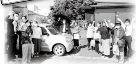
組合員、職員51名が参加し、地域訪問を行い医療生協の活動をお知らせしました。