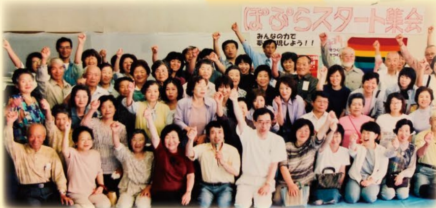
ぽぷら建設にむけて、組合員拡大行動