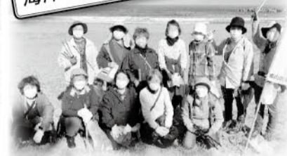
26支部でウォークイベント開催 総勢406人が参加。