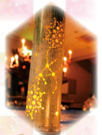
竹灯籠 彪駕・萌楓 (上市支部)