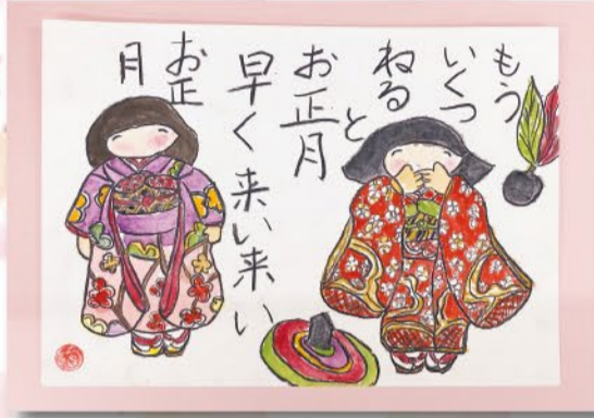
絵手紙 あきこ (山室支部)