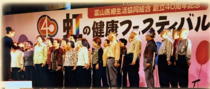
健康フェスティバルに1万人の参加