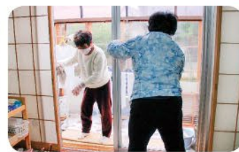
◀4月14日 五福神明支部 ボランティア班会 3名参加