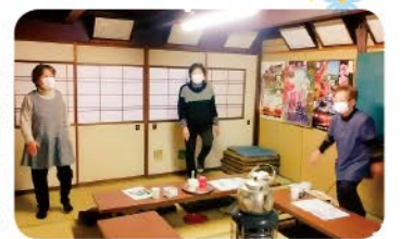
◀4月16日 岩瀬支部 リーダー班 足ぶみ体操 6名参加