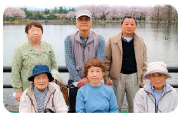
◀4月11日 和合八重津支部 花見ウォーク 6名参加