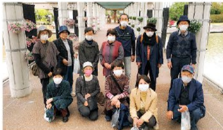
▲ 11月1日 浜黒崎支部 12名参加 WHOウォーク 植物園