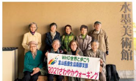
▲ 11月18日 南部支部 10名参加 WHOウォーク 水墨美術館