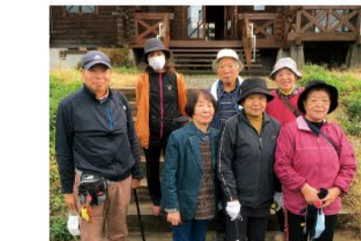
▲ 11月16日 水橋西部支部 8名参加 パークゴルフ