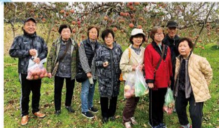
▲ 11月14日 広田支部 8名参加 りんご狩り