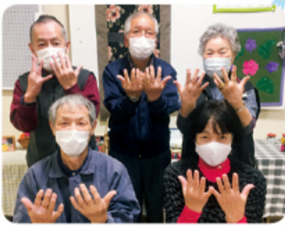
▲11月16日 三郷支部 手洗い班会 5名参加