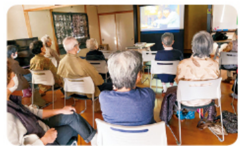
▲11月24日 五福支部 支部レク DVD鑑賞会 14名参加