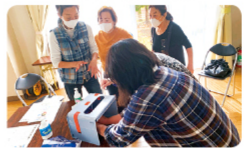
▲11月19日 山室支部 青葉団地班 手洗い班会 5名参加