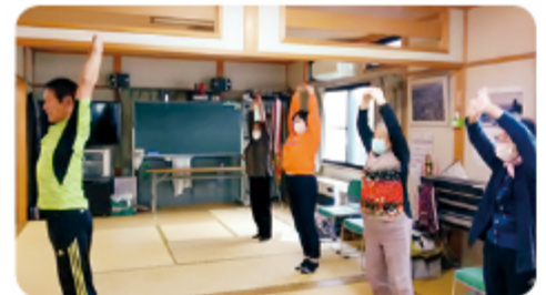
▲11月16日 奥田東支部松若町班 つばおし体操班会 7名参加