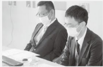
モニターで高校生に対応する面接官

富山県民主医療機関連合会(富山県医連)に加盟する「富山医療生活協同組合」では、医療や介護の仕事を指す学生さん一人ひとりを応援しています。第一線の医療、介護の状況を知ってもらおうための現場実習や、学ぶ環境を支援する奨学金制度などの取り組みを行っています。 昨年の十一月には、医学部