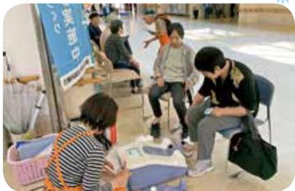
▲5月17日 高岡支部 高岡ふれあい福祉センター健康チェック 59名参加