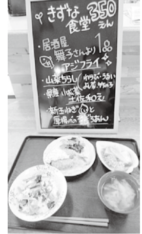
▲ご近所の居酒屋さんよりアジフライの提供が!!

「きずなサロン」では笑いヨガやシルバーリハビリ体操、「遊書」、小物づくり、料理教室など多岐にわたる内容で、地域の人たちが気軽に集まることのできる場づくりをすすめています。今年、四月からは第三水曜日のお昼から「きずな食堂」を実施し、手作りのランチを三五〇円で提供しています。五月十二日にはサロンに参加された方、職員も含めて二十八名がにぎやかに食事をしました。食事づくりには地域の方のボランティアもあり、美味しいと好評です。さらに「みんなと一緒に食事すると一段と美味しいね」と参加者の声。食事を通して、地域の人、職員、ボランティアさんの楽しい交流の場となっています。