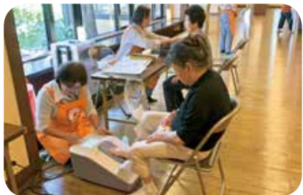
▲5月22日 南ブロック 満天の湯健康チェック 17名参加