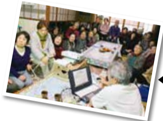
医師による健康の話