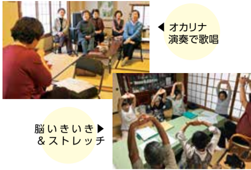
オカリナ演奏で歌唱