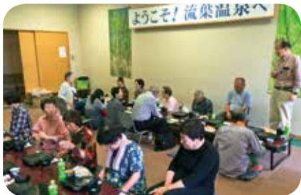
▲5月20日 水橋西部支部 新緑レクリエーション 22名参加