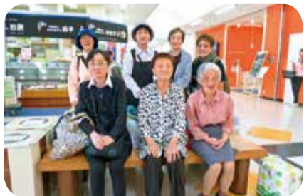
▲5月21日 とよた北支部 ひまわり班買い物班会