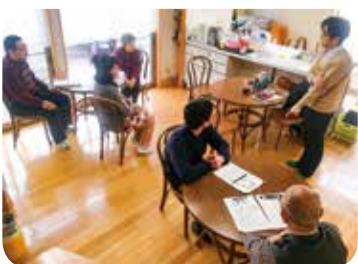
1月22日 上市支部 自然房班 ミニ健康教室 7名参加