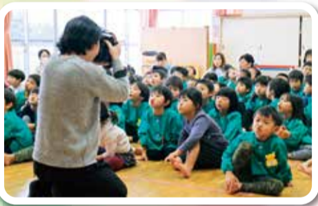
健康づくり委員会

また子どもたちからは「おうちでお父さんやお母さんと一緒にしまーす!」と元気な声が返ってきました。自宅でも実践できるよう、家族あてに「あいうべ体操」の学習プリントも配付しました。当日は医療福祉生協情報誌「comcom」の取材も受けました。(「comcom」4月号掲載予定)