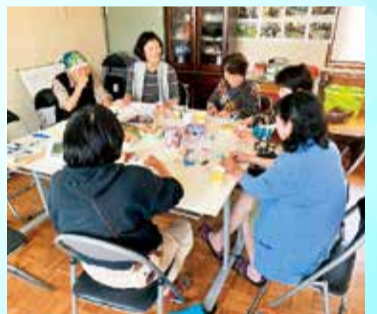
▲健康カフェ 折り紙

今年度は、たすけっとクラブの利用を通じて多く加入もあり、目標を達成しました。この要望に応えるためたすけっとクラブ活動の充実に努めたいと思います。