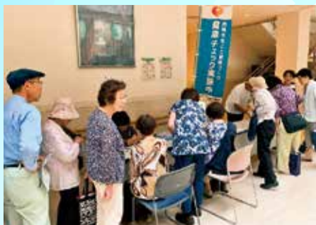
▲健康相談会ふれあい福祉センターにて

高岡支部では高岡市ボランティア連絡協議会に『医療生協高岡支部「虹のまち」』としてボランティア登録、また「サポナビ高岡」に登録し、そのホームページなどで活動が紹介されて