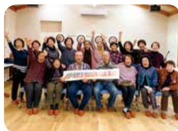
1月21日 とよた東支部 米田町長寿会 17名参加