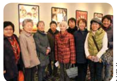
1月16日 呉羽支部 高木班 映画鑑賞会 9名参加