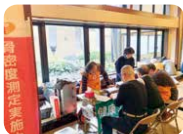
1月21日 南ブロック 満天の湯健康相談会 14名健康チェック