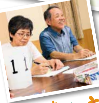
組合員活動委員会

十月五日に開催された、「ともに元気になるつどい」では、北毛保健生協の「人との出会いは財産、強化月間で広げよう」の講演、分散会では「生協の活動や普段のくらしの中で、どんな人達、グループ、団体とつながりたいか」というテーマで、自由に意見交流しました。「購買生協」「長寿会」「町内会」「民主団体」「包括支援センター」などつな