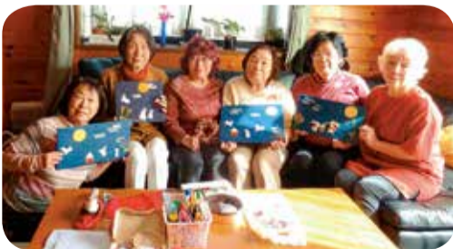
▲10月10日 とよた東支部 布布班 布遊びお月見作品づくり