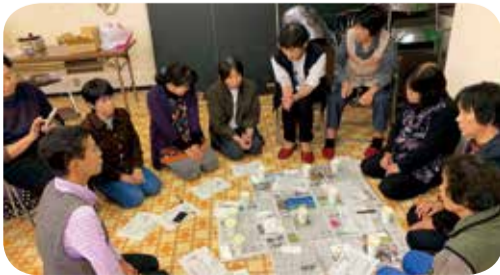
▲10月21日 高岡支部 すまいる班 尿塩分チェック 9名参加