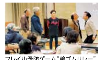
フレイル予防ゲーム「輪ゴムリレー」

防するように伝えた」「ゲームが楽しそうに思えた。ぜひ地域に帰ってやってみたい」などの感想がありました。講演を機会に地域での高齢者の健康づくりが進み、更なるオーラルフレイル予防が広がることを期待されます。