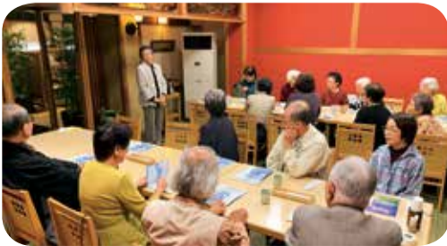
▲10月16日 南部支部 配付者交流会 18名参加