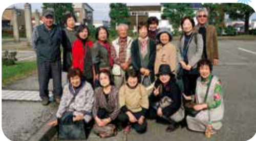
▲10月16日 新庄支部 さんさん班 レクリエーション 16名参加