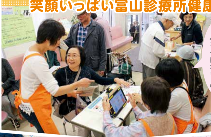
「動脈硬化 気をつけなきゃ」 血管年齢測定

10月～11月、医療生協に虹の出会い月間は医療生協を地域に広く知らせ、多くの組合員を迎え入れることで生協活動を強化する期間として全国生協で一斉に取り組まれています。富山でも各地で人が集まる楽しい企画が催され、医療生協の健康づくりやまちづくりの魅力が語られています。