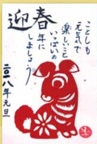
◀切り絵 川越美子 (となみ野支部)