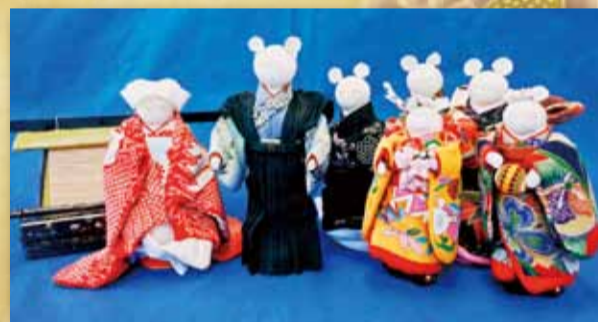
◀寿人形 進士京子 (とよた東支部)

おでんは、汁を食べる量に比例して塩分摂取量が増えるので、とる量にはご注意ください。 また、おでんだねの練り製品には塩が練り込まれているので少量を効果的に使うと良いでしょう。食塩相当量の例) 焼きちくわ大1本…2.1g さつま揚げ1枚(30g)…0.6g 今回のように鶏手羽元や歯ごたえのよいれんこんを組み合わせるのも満足度維持のポイントです。