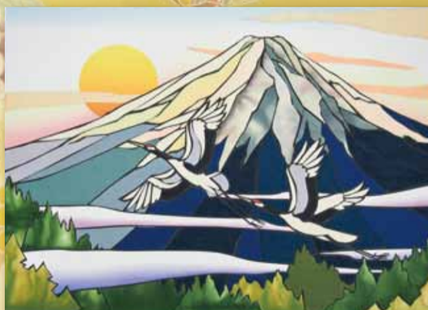
◀富士の日の出 池田恵子 (山室支部)