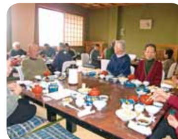
◀12月12日 配付者交流会 20名参加