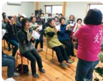
◀12月16日 健康カフェ 大広田支部 25名参加