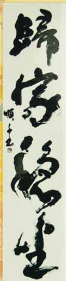
◀書 高尾順子 (山室支部)