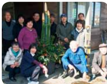
◀12月20日 門松づくり 婦中支部