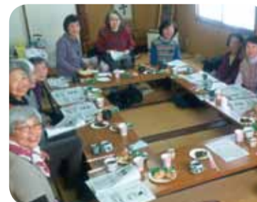
◀12月6日 北代班 血管年齢測定 13名参加