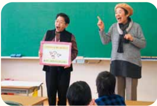
立山町 立山北部小学校

子どもの健康づくり「キッズチャレンジジャー」の取り組みが地域の小学校や学童保育、保育園・幼稚園などを通じて広がっています。インフルエンザ、風邪予防にと「あ