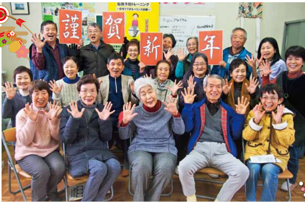
▲高岡支部「虹のまち家」にて