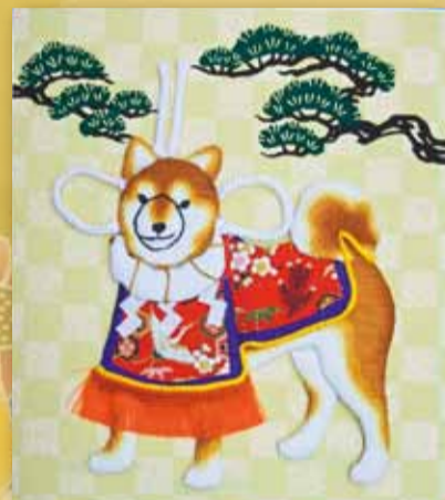
◀押し絵 徳室スミ子 (水橋西部支部)