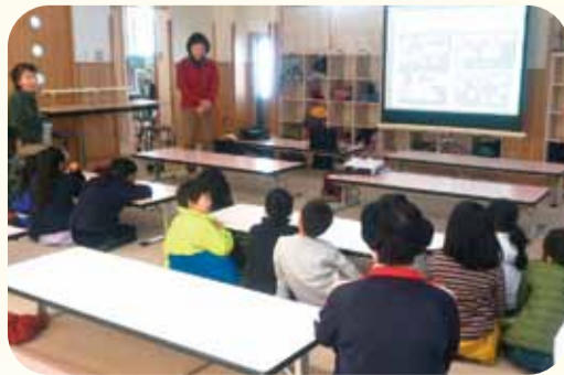
射水市 歌の森小学校