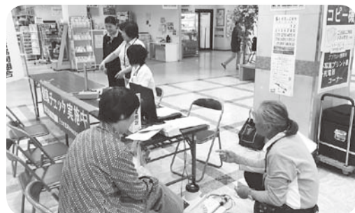
▲5月13日 水橋支部「ミュージック健康相談会」24名健康チェック