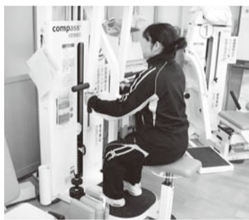
▲マシントレーニング

通所リハビリテーションとよたシヤキシヤキでは、介護保険制度において要支援、要介護と認定された方のうちリハビリが必要な方に、活動的に過ごしていただけるようリハビリのお手伝いをさせていただいております。