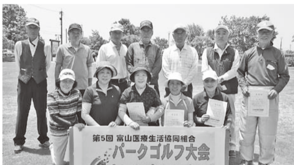
20日の入賞者の皆さん