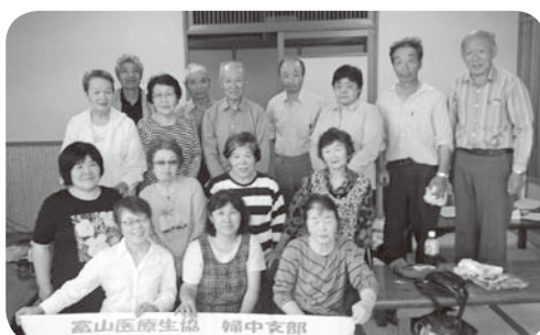
▲5月28日 婦中支部「山菜取りレクリエーション」16名参加