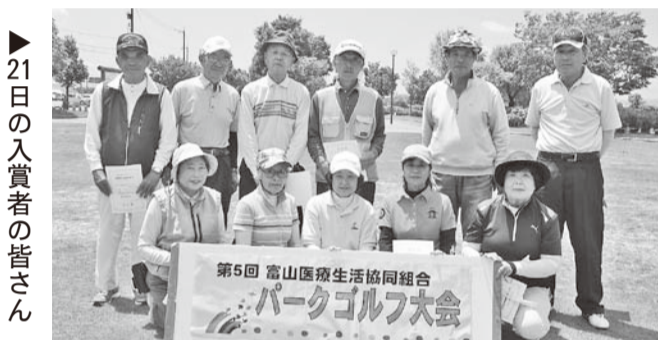
▶21日の入賞者の皆さん

ご利用、協力者登録のお問い合わせは「たすけっとクラブ」☎076-441-8354まで