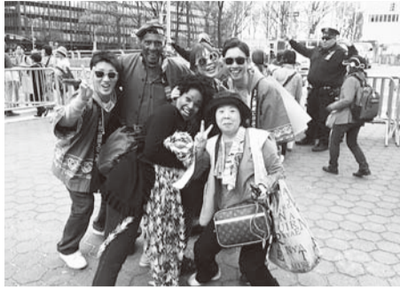
▲海外参加者の方達と記念撮影

に繋がる」という事を強く訴えられており、今後も平和行進に参加することや学んで来たことを院内・院外で伝えることが出来ればと思っております。