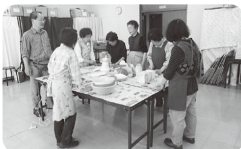
▲5月19日 南部支部合同班会「ゴキブリ団子づくり」9名参加