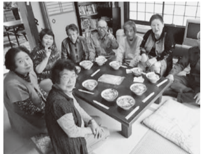
▲楽しくお食事(200円ランチ班)

認知症予防の為に、脳いきいき班会を月一回開催。みんなで笑っておしゃべりが何よりの認知症予防に