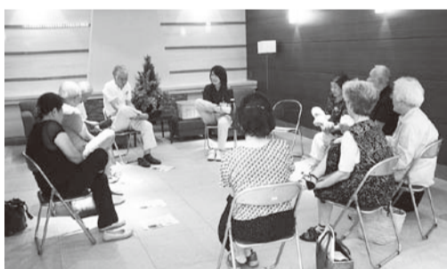
▲シルバーリハビリ体操を実施(シティ班)

戦後七〇年を迎え、戦争 体験者は高齢となり語り継 ぐ人も少なくなる中、国民 に十分に知らされないまま