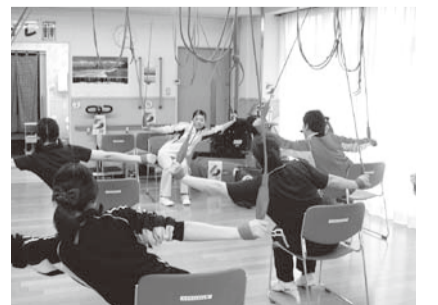
▲レッドコードエクササイズ

平日の十五時半から十七時までは、マシンとレッドコードを組合員さんに開放しています。定期的に班会の活動として利用されています。