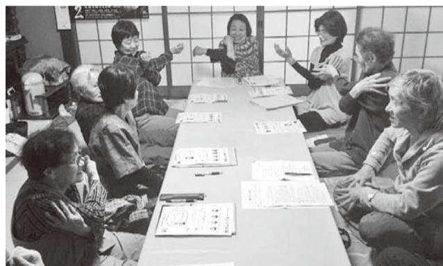
▲ストレッチ体操は毎回1~2種類行ないます

「いち、に、さん、し」と声をかけながら筋を伸ばして、ストレッチ体操。身体もこころもリフレッシュします。頭を使ったゲームを楽しみ、読み物を声を合わせて音読。その後はにぎ