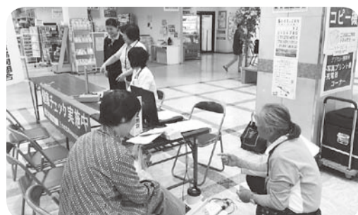
▲5月13日 水橋支部「ミュージック健康相談会」24名健康チェック