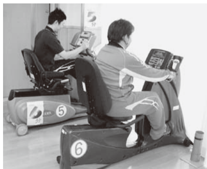
▲マシントレーニング

レッドコードエクササイズでは、天井から吊り下げた二本の赤い縄を使用し、体を前後左右に普段動かすことの出来ない範囲まで動かして、バランスや姿勢の改善の訓練に取り組んでいます。