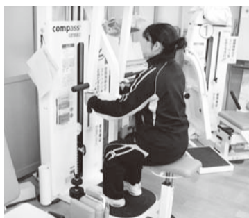
▲マシントレーニング

通所リハビリテーションとよたシヤキシヤキでは、介護保険制度において要支援、要介護と認定された方のうちリハビリが必要な方に、活動的に過ごしていただけるようリハビリのお手伝いをさせていただいております。