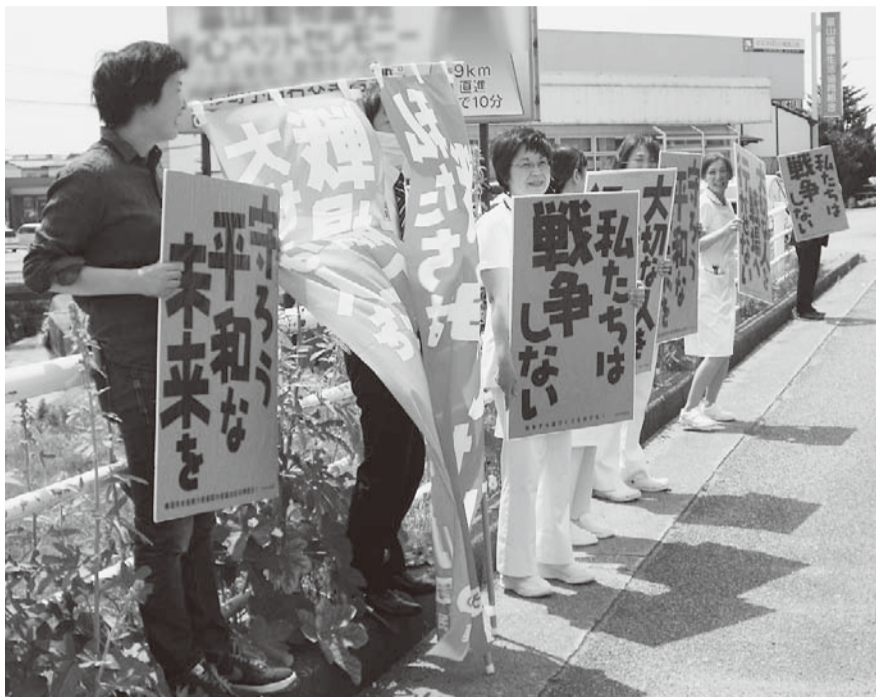
▲沿道でプラカードを掲げて「戦争反対」をアピール