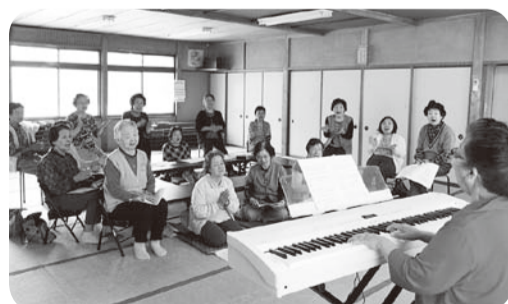
▲5月13日 犬島班会「コーラス」15名参加