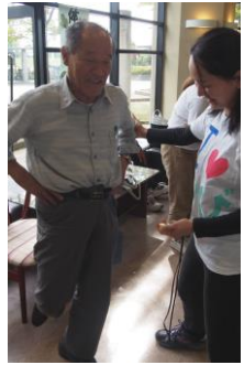
開眼片足立ちに挑戦

んによる落語が行われました。富山ダルクの皆さんは太鼓の迫力はもちろん、薬物やアルコール依存から抜け出すために共同生活で太鼓などに取り組みながら社会復帰を目指していることを紹介し、会場からは「初めて薬物依存回復の施設があることを知った。応援したい」といった声が聞かれました。落語でも「おもしろいだけでなく、役に立つお話もあり、とてもよかったです」などの感想がありました。