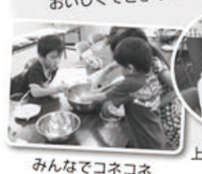
みんなでコネコネ