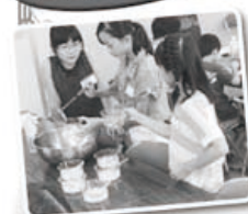
おいしくできました