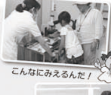
こんなにみえるんだ！