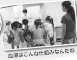
血液はこんな仕組みなんだね