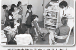
お口の中はこうなってるんだ！