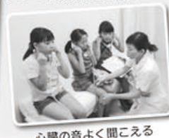
心臓の音よく聞こえる