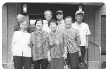
8月26日 とよた東支部水落班 入浴班会 8名参加