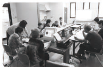
8月12日 山室支部カトレア班 動脈硬化の予防 14名参加