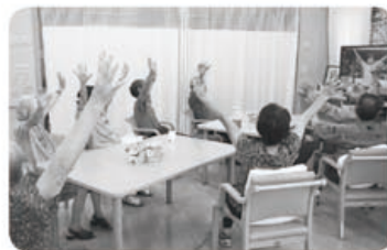
8月10日 三郷支部 配付者交流会 10名参加