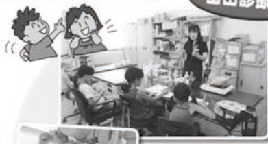
ジュースには砂糖がいっぱい