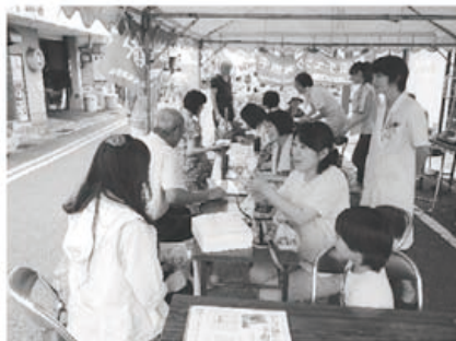
▲たくさんの方に、健康チェックを受けてもらいました

当日はとても暑い日でしたが、中央西支部の二名の組合員さんにもテントの設置や骨密度測定、呼び込みなどの協力を頂きました。今年も、例年の血圧測定・