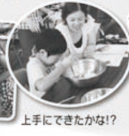
上手にできたかな？