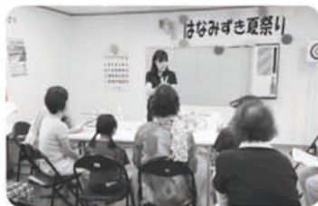
8月21日 射水支部 はなみずき夏祭り 15名参加