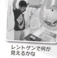
レントゲンで何が見えるかな