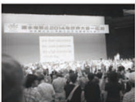
▲原水爆禁止世界大会の様子

ご利用、協力者登録のお問い合わせは「たすけっとクラブ」☎076-441-8354まで