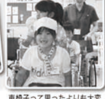
車椅子って思ったよりも大変