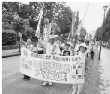
▲行進しながら、沿道の人達にアピール

いのち・健康・くらしを破壊し人権を奪う戦争・核兵器は許すことができません。また「戦争をしない国」から「戦争をする国へ」の動きが強まっています。平和を守る取り組みを紹介いたします。