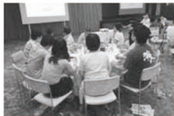
▲真剣に学ぶ医学生

八月七日、九月一日、愛媛県奥道後温泉「茗湯の守」にて「民医連の医療と研修を考える医学生」