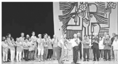
▲三重から富山へ「大会旗」の引き継ぎ

ご利用、協力者登録のお問い合わせは 「たすけっとクラブ」 ☎076-441-8354まで