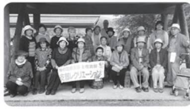
▲5月19日 上市支部 丸山総合公園にてウォーキング 23名参加