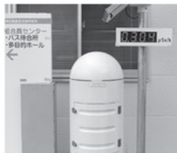
▲放射線量を測るモニタリングポスト

今回の震災で郡山市は震度六弱を観測し、原発事故に伴う放射能の雲(プルーム)が流れ込み、夜間には放射能雨が降りました。三月十五日には市役所玄関前で放射線量2.26マイクロシーベルト/時間(年間72ミリシーベルト)を記録しています。全半壊戸数も二万户に及び、これは仙台市・いわき市・石巻市に次ぐ被害であり、津波被災のない内陸の都市としては最大の被害でしたが、幸い人的被害は少なく死者はありませんでした。取り壊した後の更地やブルーシートの覆われたままの建物も少しはありますが、全体には復旧工事は終了している感じでした。