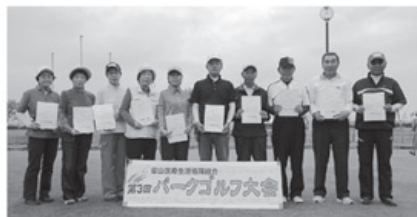
▲30日入賞者の皆さん