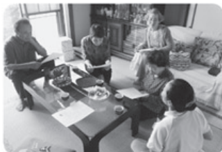
▲5月23日 中央東支部 雄山町班 健康教室・日常 生活の工夫 4名参加