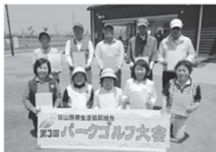
▲31日入賞者の皆さん