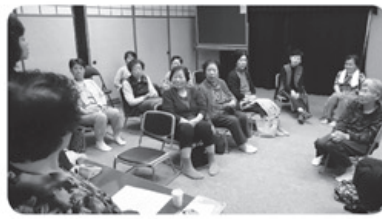
▲5月20日 和合八重津支部 さつき班 尿チェック班会 13名参加