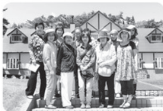
▲5月23日 とよた南支部 豊田本町3・4丁目班 あいやまガーデンで散策 水見