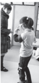
▲先が見えなくてこわいよ

て学習会を開催しました。参加されたお母さんや子ども達からはよい体験が出来たと好評でした。今後認知症の方だけでなく、高齢者、障がい者等全ての方々が安心して暮らせるまちづくりを目指し、それぞれの年代にあった学習会を開催していきたいと思えます。