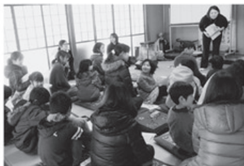
▲小学生～中学生の親子8組参加