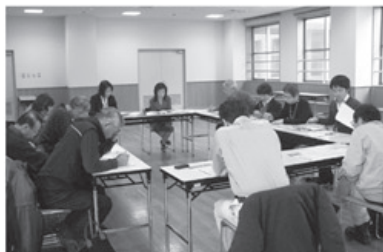
▲富山市保健所から報告を受ける参加者ら

保健所からは、市民の健康づくりの「健康プラン21」の取り組み状況や今後の課題、がん検診の受診状況が報告されました。医療生協からは病院でのがん検診普及の工夫や「大腸がん検診班会」など、実例を交えて報告しました。