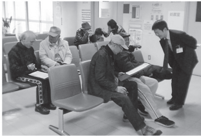
▲事業所利用委員会の取り組み・病院待合室でアンケート